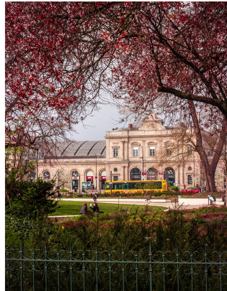
Gare de Reims

Le secteur Saint-André, parsemé de commerces historiques, séduit toujours plus de Remois et accueille aussi de nouvelles vitrines à mesure que les populations du centre y migrent. L'avenue Jean Jaurès est à la fois une porte d'entrée dans Reims et la route en direction des Ardennes.